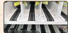
Conveyor belt slot